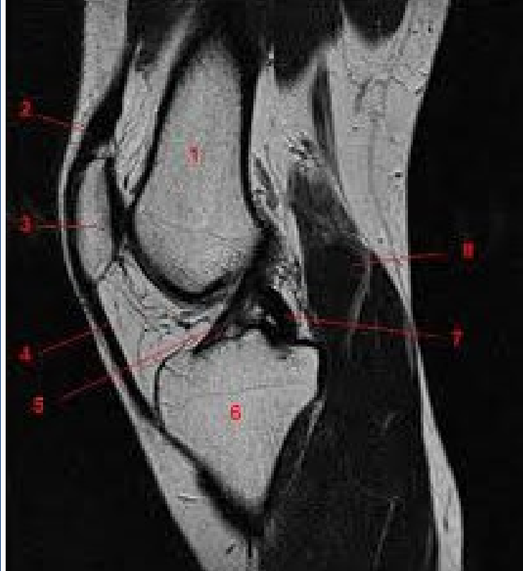
MRT mit Kreuzband