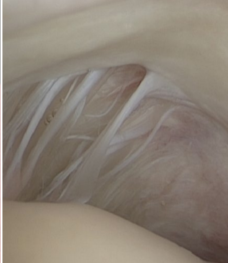
Anriss der Sehne

Man sollte intensiv an der Körperhaltung arbeiten. Das bedeutet, sich aufrichten und die Schultern zurückführen. Dies gelingt aber nur durch Übungen bei der Krankengymnastik oder im Fitnessstudio. Ohne die Muskulatur zu trainieren gelingt das nicht.